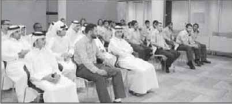
طلاب المدارس الثانوية يستمعون لشرح عن البرنامج