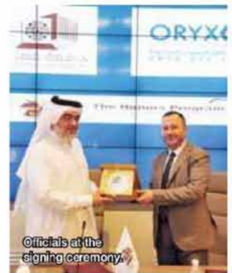
Officials at the signing ceremony.