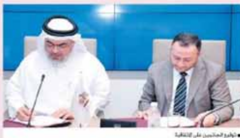
القائمون بالتوقيع على الاتفاقية

three female) with the highest Grade Point Average (GPA) will be recognised and support the work of four students undertaking engineering research or design projects, particularly those related to GTL.